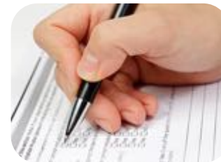
Questionnaire clinique à compléter en consultation

Nous vous remercions par avance pour votre contribution à ce programme.