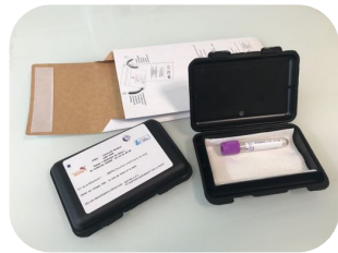
Kit de prélèvement avec enveloppe pré-affranchie

Nous vous ferons parvenir le matériel nécessaire à un prélèvement sanguin et son envoi.