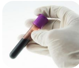
Prélèvement sanguin sur anticoagulant (EDTA)